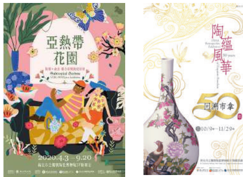
圖 1、2：「亞熱帶花園 - 陶博 x 故宮聯合彩繪陶瓷展」 以及「陶蘊風華 - 回溯市拿五十年」展覽

以 2020 為橫斷面，從初春年後到深秋的十月，國立台北科技大學 USR 大學社會責任子計畫 - 「陶瓷文化培力•鶯歌地方創生」團隊，在晴雨往返鶯歌的路徑中，透過陶瓷彩繪技錄下鶯歌的沉浮、轉折與生命力，工藝影像紀錄的對話，重複不斷出現許多熟悉卻又充滿距離的關鍵字，對應新北市立鶯歌陶瓷博物館所舉辦的「亞熱帶花園 - 陶博 x 故宮聯合彩繪陶瓷展」，以及「陶蘊風華 - 回溯市拿五十年」(圖 1、2)，開啟梳理陶瓷彩繪發展的必要性。